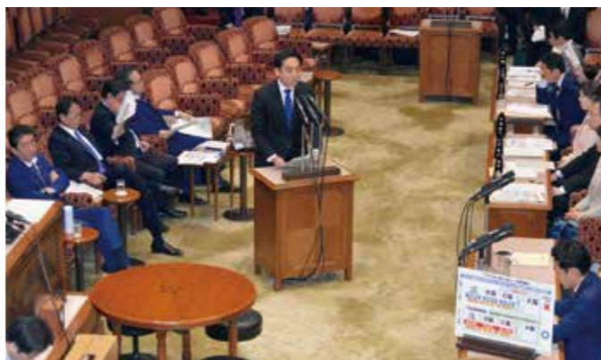
予算委員会において、同僚の矢倉かつお議員の質問に政務官として答弁(3月)