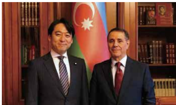
アゼルバイジャンのマフマドフ首相とは、今後のエネルギー分野における両国の協力関係を確認 (5月)