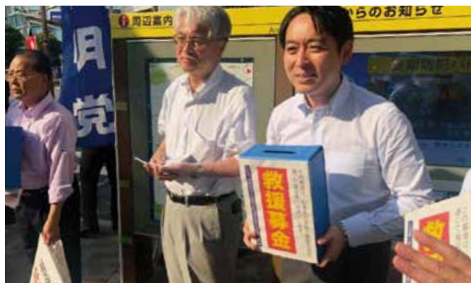
平成30年7月豪雨被災者救援のために、ボランティアの方々と街頭に立つ (7月)