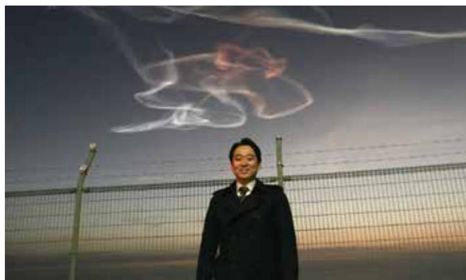
地球観測衛星 ASHARU-2 はデータビジネス創出の大きな可能性を秘める。打ち上げ後は幻想的なロケット雲が (1月)

党青年委員長として、大臣政務官として、そして何より皆さまの代表として、東奔西走した本年上半期を写真で振り返ります。