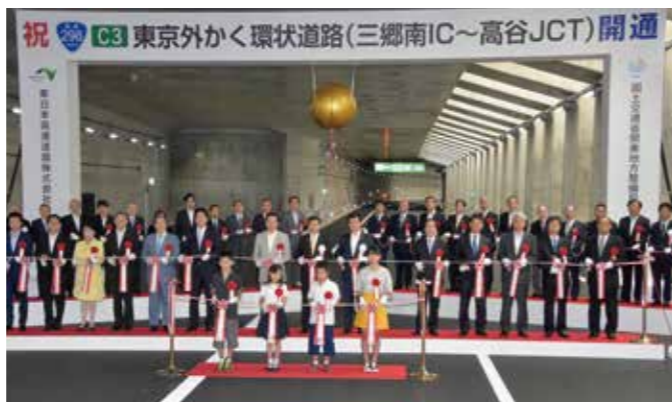
外環道(三郷南IC~高谷JCT)がついに開通。北関東圏の相互アクセスが便利に (6月)