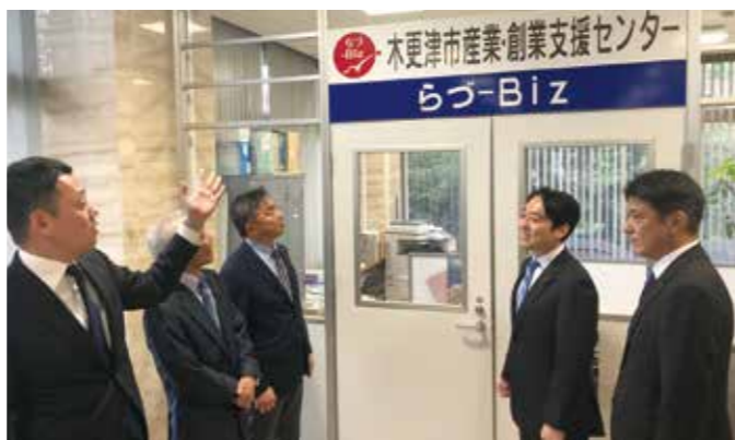
地域の特性を活かした、地方自治体による中小企業支援拠点が広がる。写真は木更津市に開設した産業・創業支援センター (通称 らぶ-Biz) (4月)