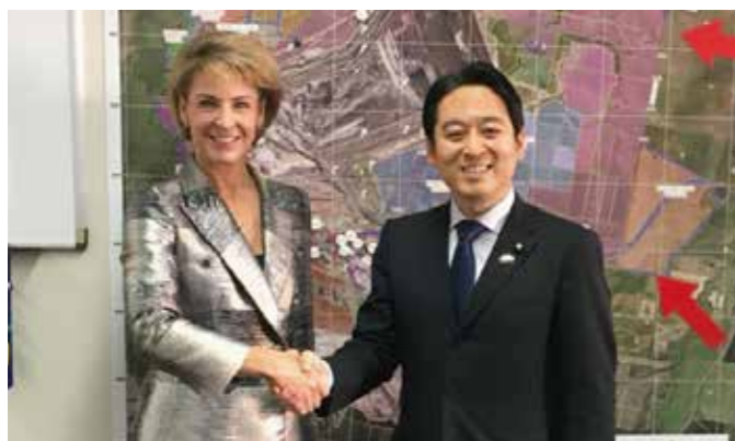
豪州キャッシュ雇用・イノベーション大臣と、日豪イノベーション協力について意見交換 (4月)